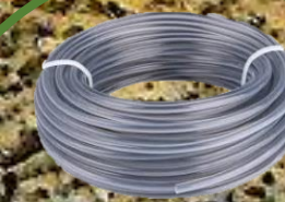
struna do sekačky pravděpodobně nikdy