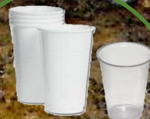
plastový kelímek 70 let