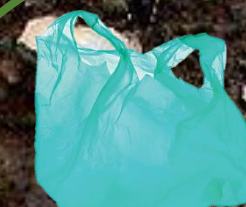
igelitový sáček, taška 25 let