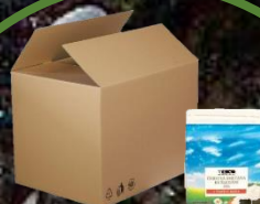
kartonová krabice, obal od nápojů bez alobalu 5-10 let