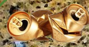
hliníková plechovka 400 let