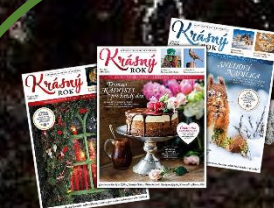
časopisy, letáky 10 let