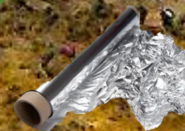
alobal 100 let