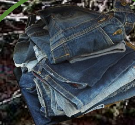
textil, vlna 1-5 let