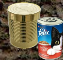
plechovky 15-100 let