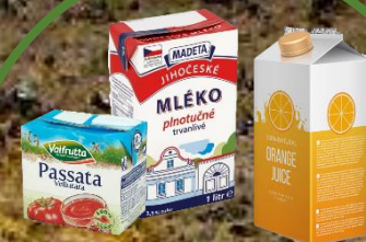
Tetra pack 100 let