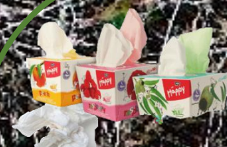
papírový kapesník 2-5 měsíců