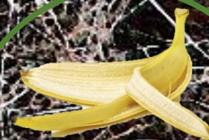
slupka od banánu 3-6 měsíců