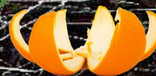
pomerančová slupka 1-1,5 roku