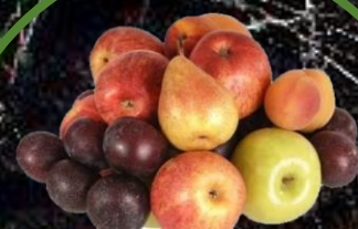
jablko, hruška, švestka 10-30 dní