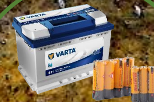
autobaterie, baterie 200-500 let