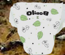
jednorázové pleny 250 let