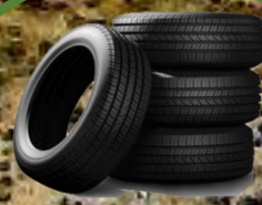
pneumatiky 265 let