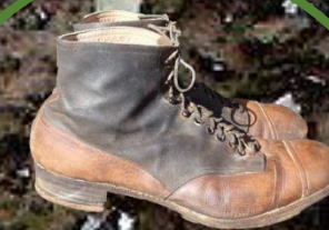
kožené boty 40 let