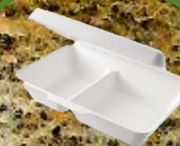
polystyren tisíce let