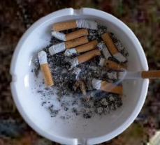
nedopalky cigaret s filtrem 10-20 let