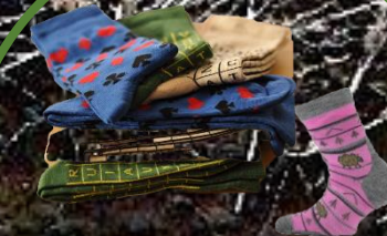
ponožky 1-2 roky