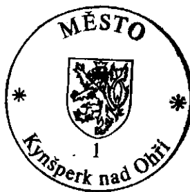
kulaté razítko města

Vyvěšeno na úřední desce dne : 29.09.2006